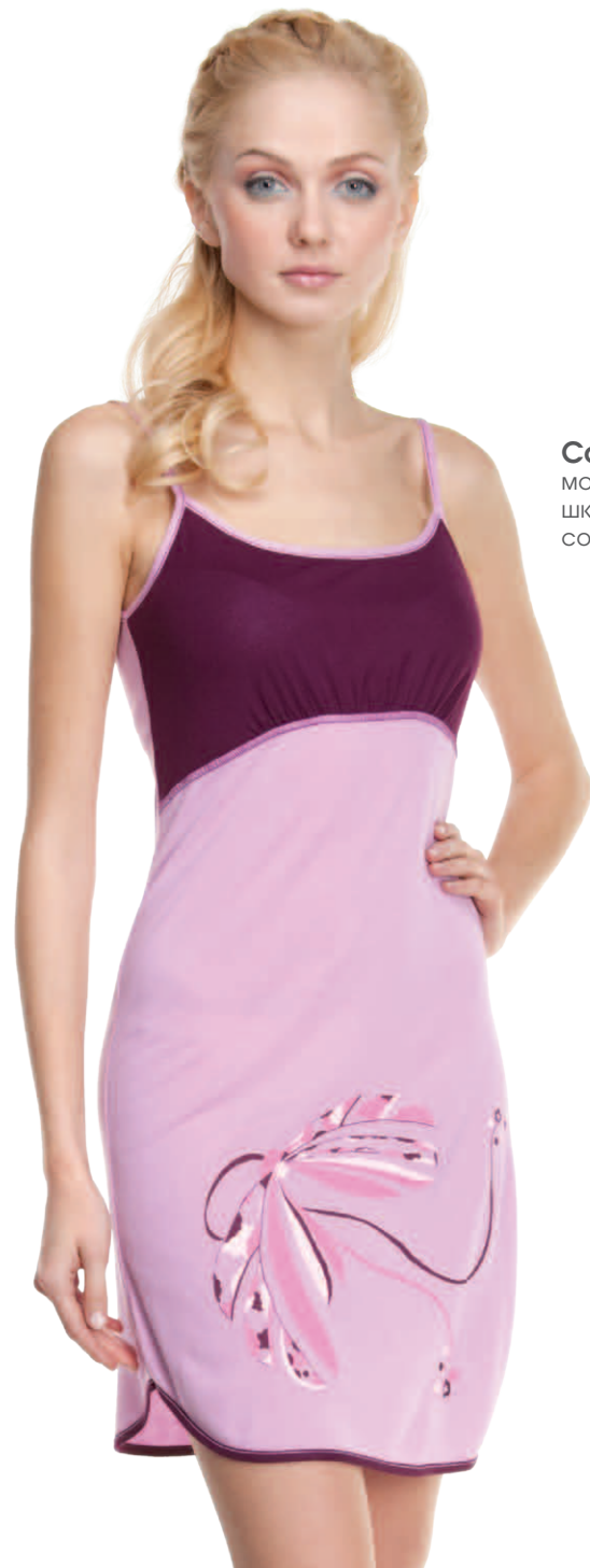
Сорочка женская модель 3810W шкала размеров: 84-104 состав: вискоза 100%