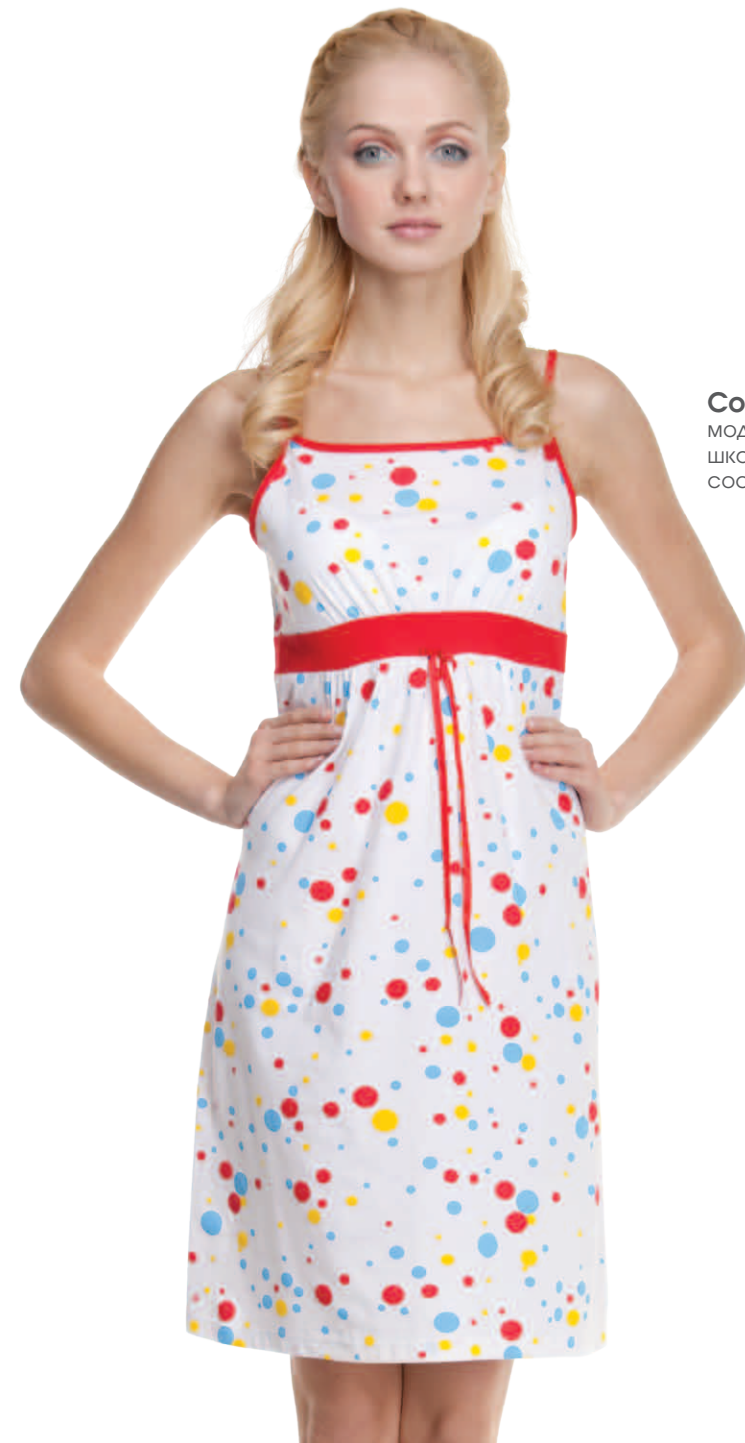
Сорочка женская модель 3855W шкала размеров: 84-104 состав: хлопок 100%