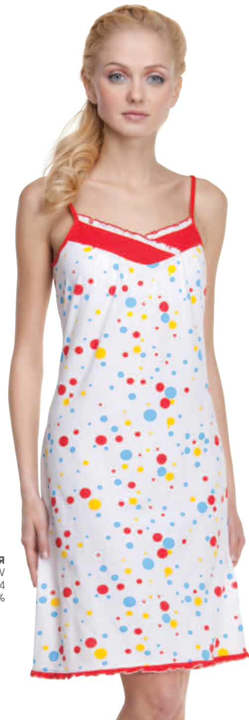
Сорочка женская модель 3858W шкала размеров: 84-104 состав: хлопок 100%