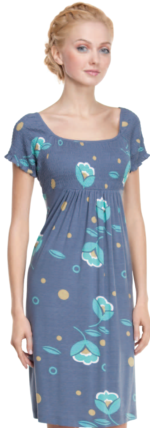
Платье женское модель 3879W шкала размеров: 84-108 состав: вискоза 92%, лайкра 8%