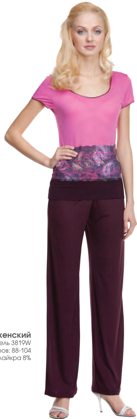
Комплект женский модель 3819W шкала размеров: 88-104 состав: вискоза 92%, лайкра 8%