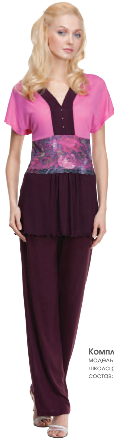
Комплект женский модель 3817W/3817W шкала размеров: 88-100/104-116 состав: вискоза 92%, лайкра 8%