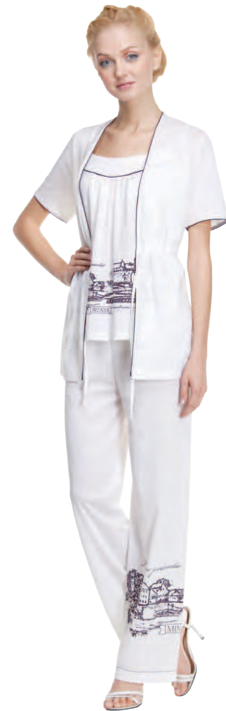
Комплект женский модель 3867W/3867AW шкала размеров: 88-100/104-116 состав: лен 8 %, хлопок 48 %, п-э 44%