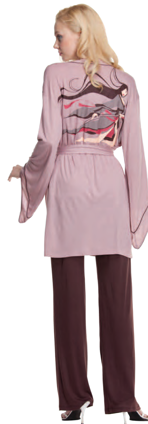
Комплект женский модель 3815W/3815AW шкала размеров: 88-100/104-116 состав: вискоза 100%