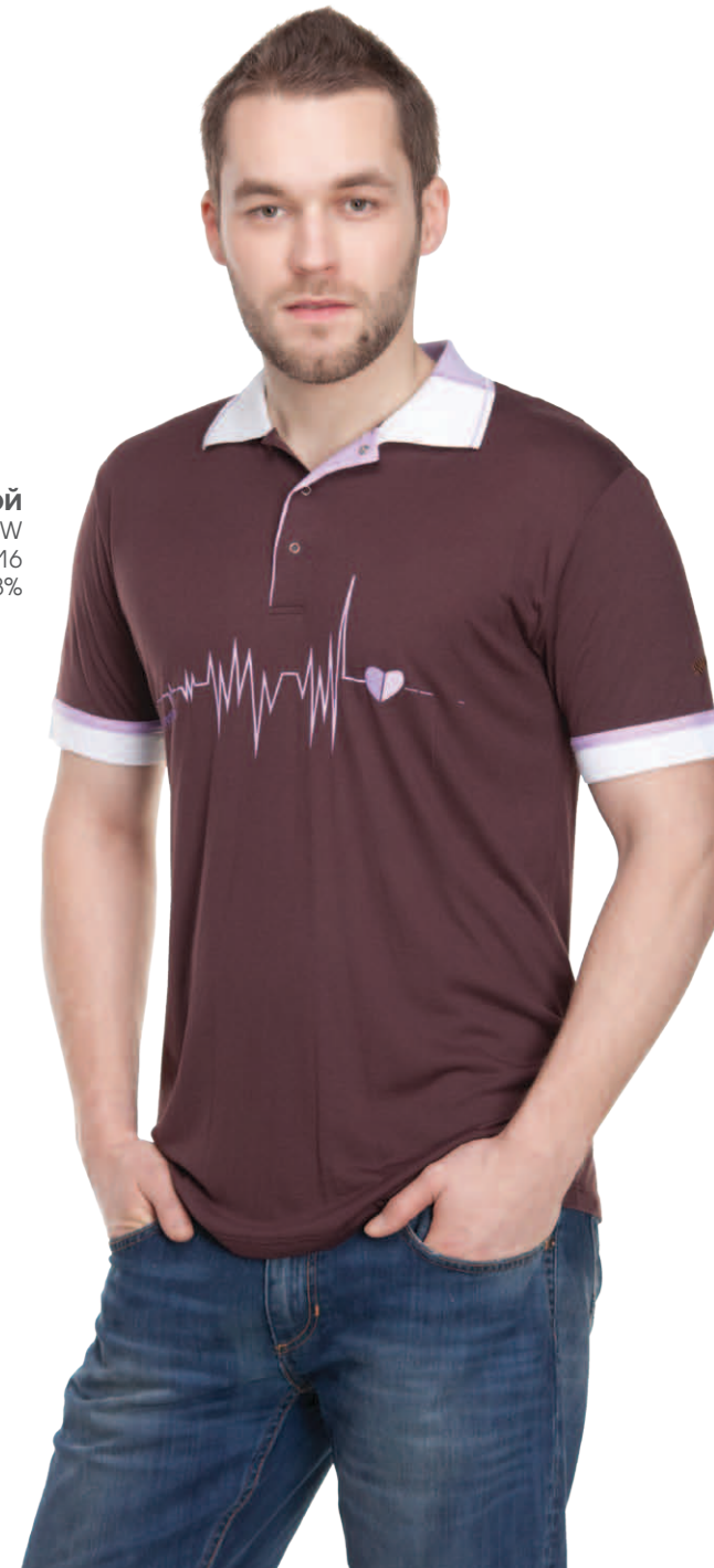
Джемпер мужской модель 1413W шкала размеров: 88–116 состав: вискоза 92%, лайкра 8%