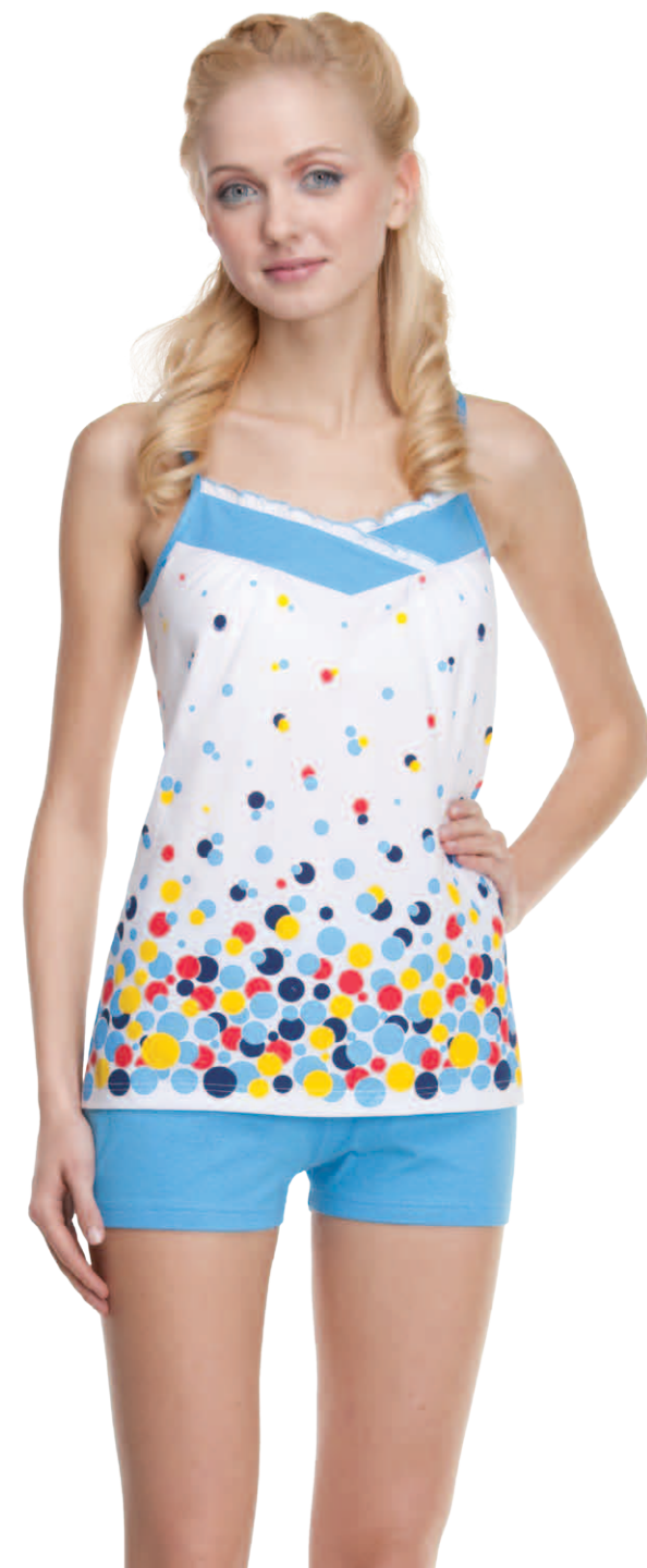
Пижамы женская модель 3857W шкала размеров: 84-104 состав: хлопок 100%