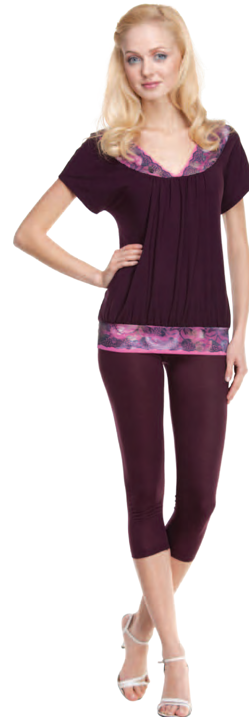
Комплект женский модель 3818W шкала размеров: 88-104 состав: вискоза 92%, лайкра 8%