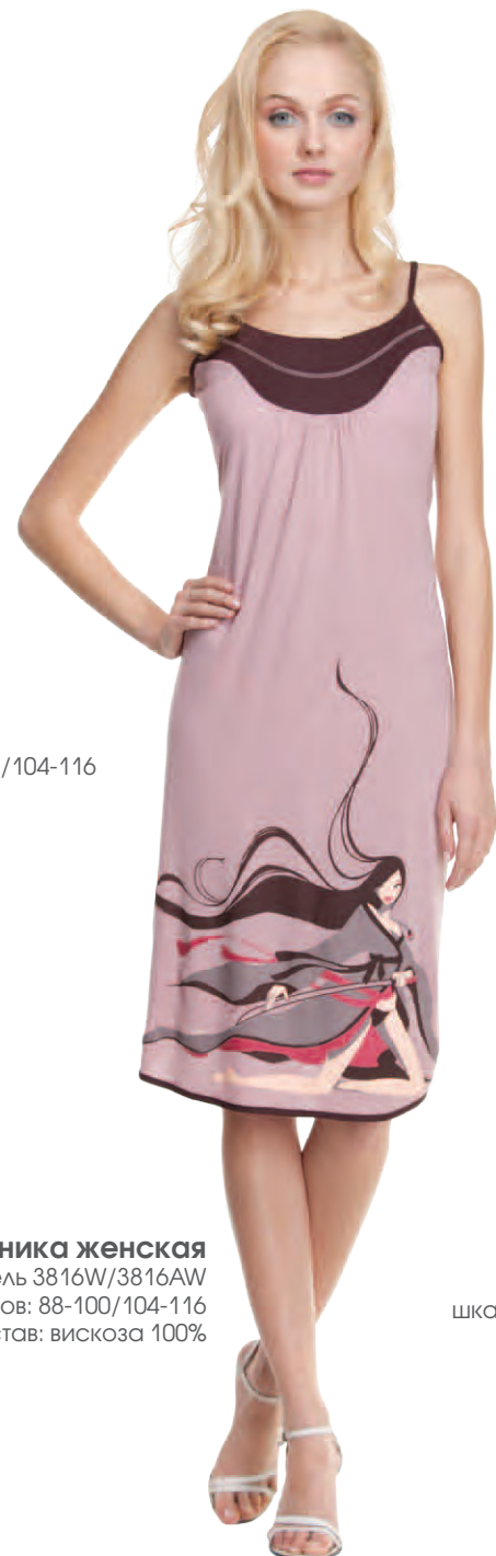
Туника женская модель 3816W/3816AW шкала размеров: 88-100/104-116 состав: вискоза 100%