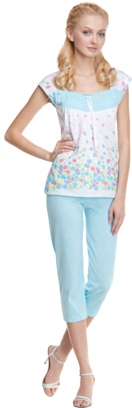
Пижама женская модель 3851W/3851AW шкала размеров: 96-116/120-128 состав: хлопок 100%