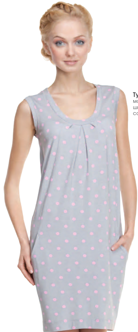
Туника женская модель 3875W шкала размеров: 84-108 состав: вискоза 92%, лайкра 8%