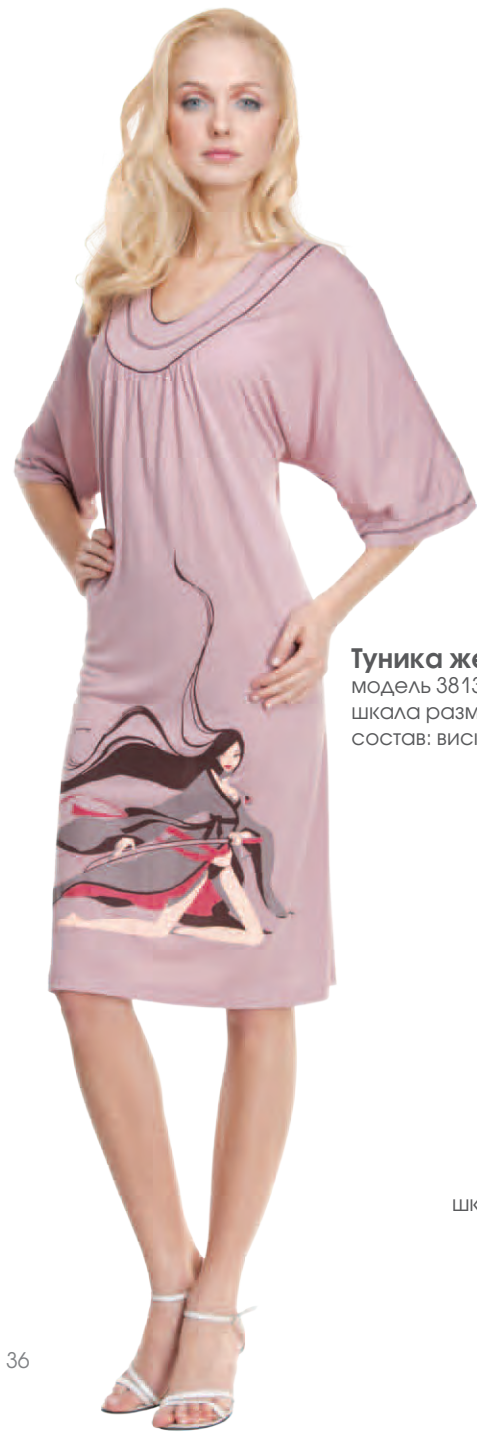
Туника женская модель 3813W/3813AW шкала размеров: 88-100/104-116 состав: вискоза 100%