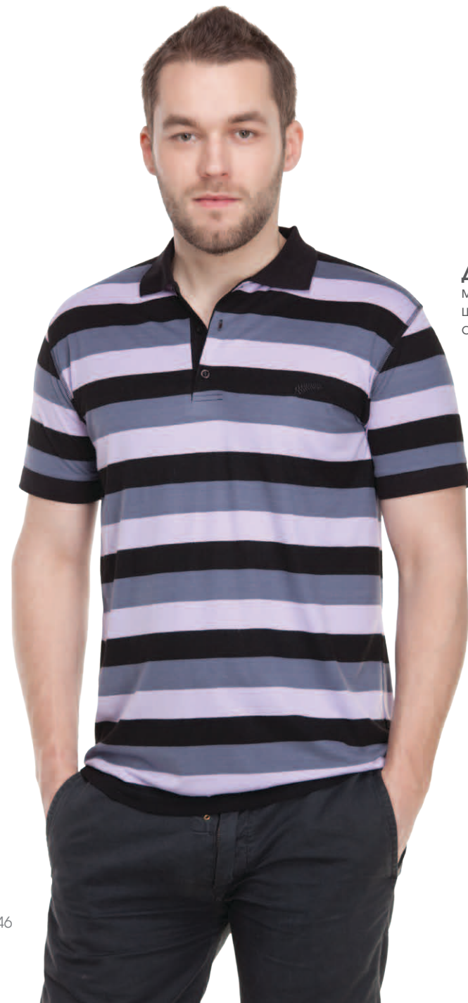
Джемпер мужской модель 2003W шкала размеров: 88-116 состав: вискоза 92%, лайкра 8%