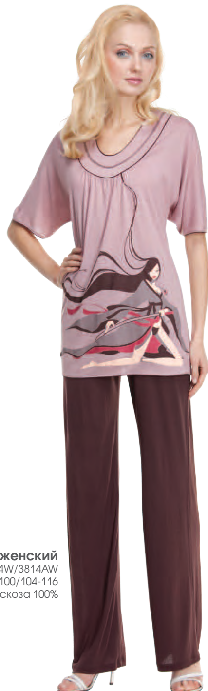
Комплект женский модель 3814W/3814AW шкала размеров: 88-100/104-116 состав: вискоза 100%