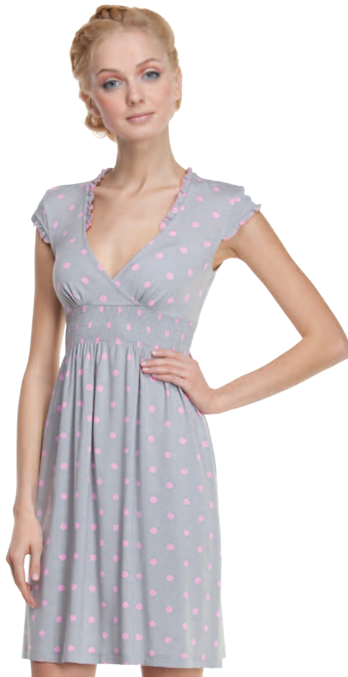
Платье женское модель 3874W шкала размеров: 84-100 состав: вискоза 92%, лайкра 8%