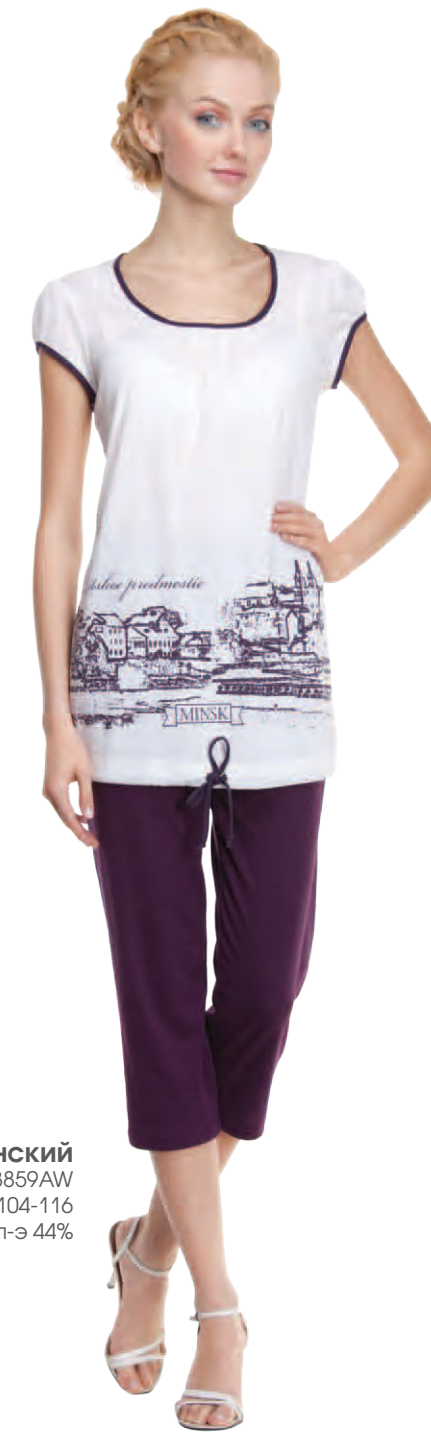
Комплект женский модель 3859W/3859AW шкала размеров: 88-100/104-116 состав: лен 8 %, хлопок 48 %, п-э 44%