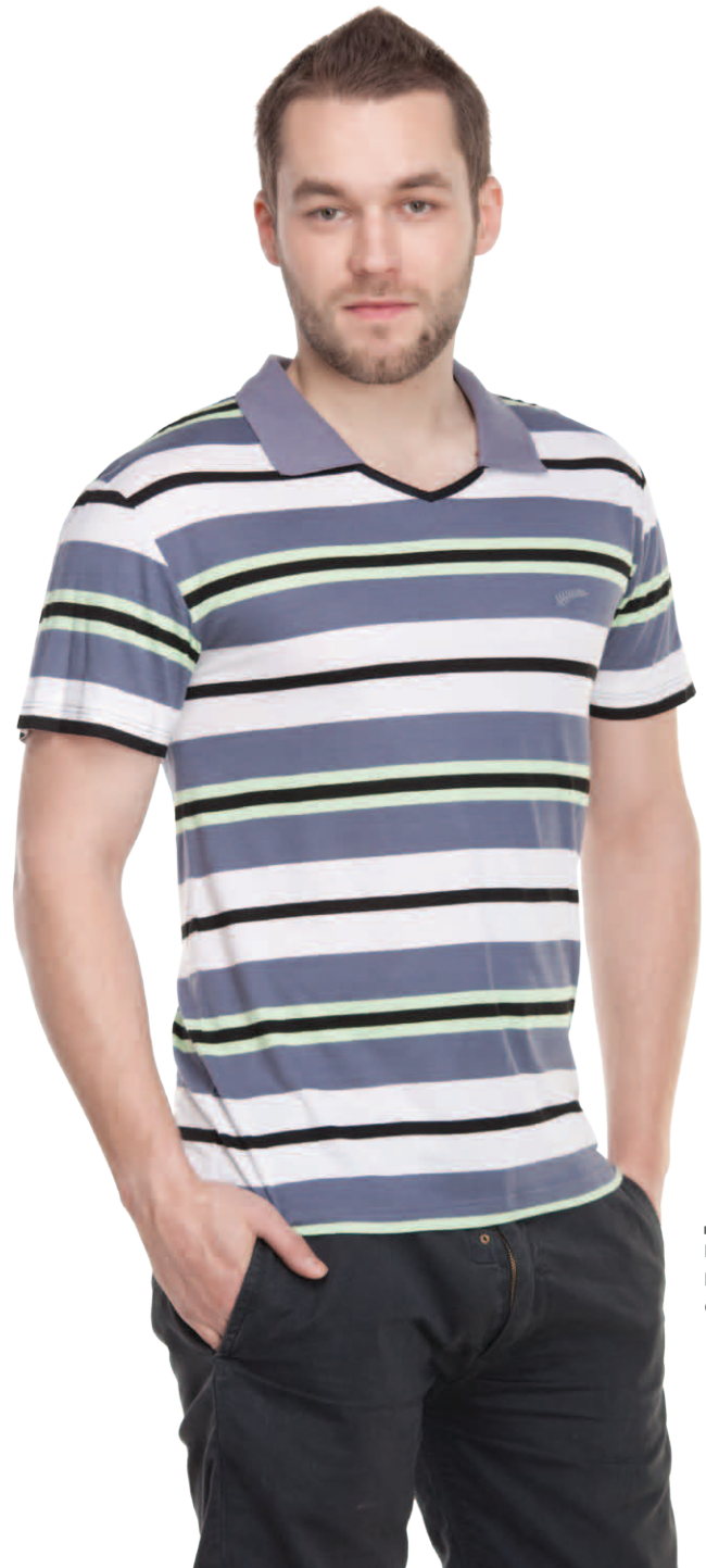
Джемпер мужской модель 1406W шкала размеров: 88–116 состав: вискоза 92%, лайкра 8%