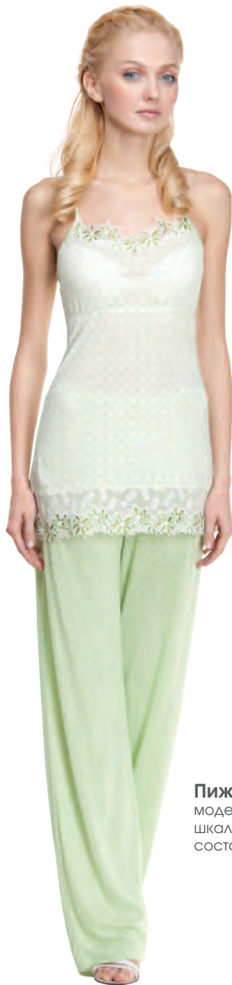
Пижамa женская модель 3376W шкала размеров: 84-104 состав: вискоза 100%