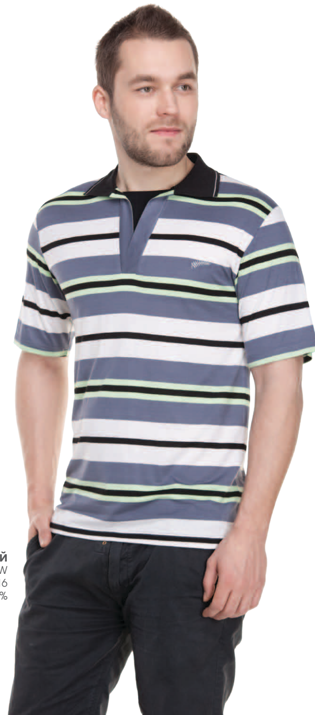
Джемпер мужской модель 1409W шкала размеров: 88-116 состав: вискоза 92%, лайкра 8%