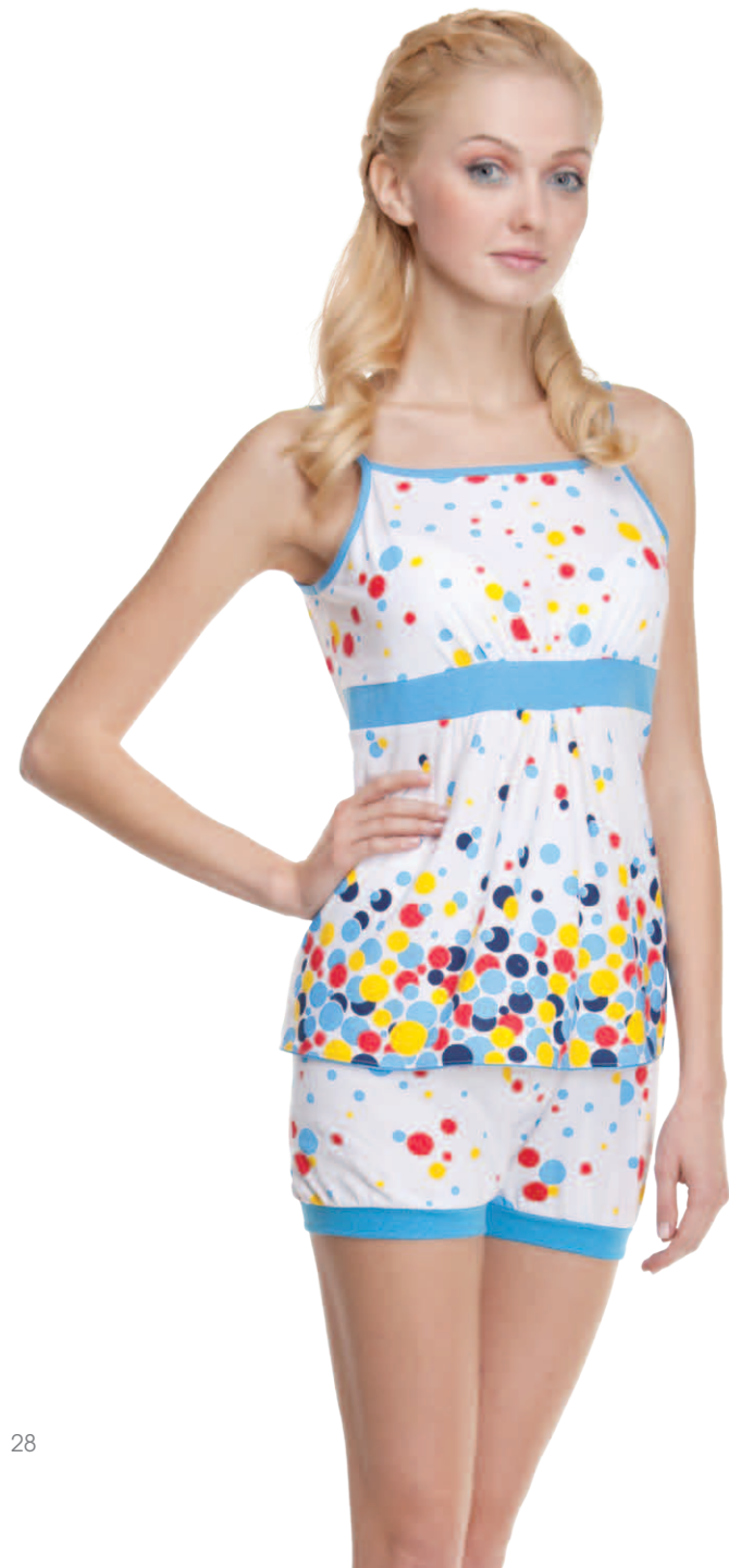
Пижамы женская модель 3856W шкала размеров: 84-104 состав: хлопок 100%