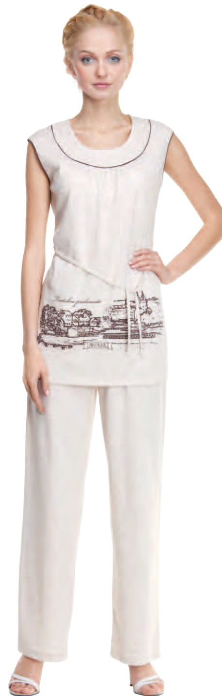
Комплект женский модель 3861W/3861AW шкала размеров: 88-100/104-116 состав: лен 8 %, хлопок 48 %, п-э 44%