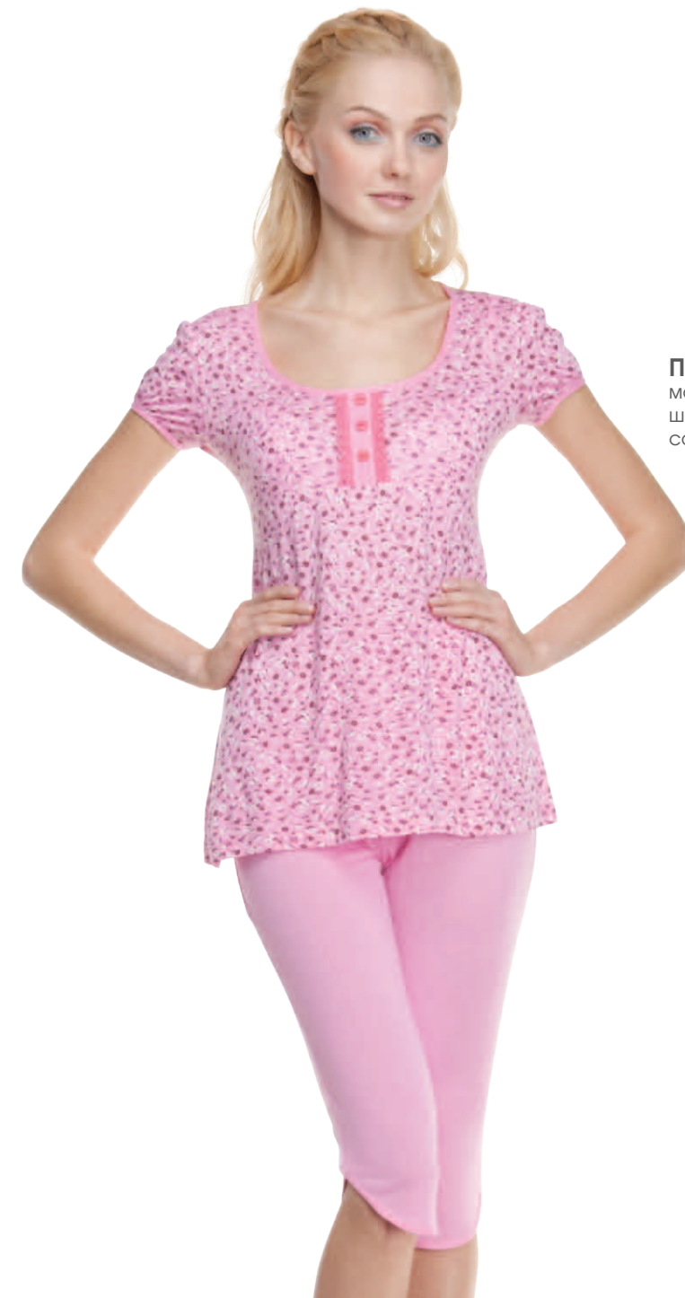
Пижама женская модель 3725W шкала размеров: 88-108 состав: вискоза 100%