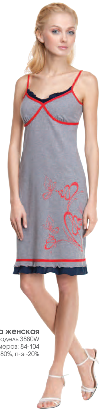
Сорочка женская модель 3880W шкала размеров: 84-104 состав: хлопок -80%, п-э -20%