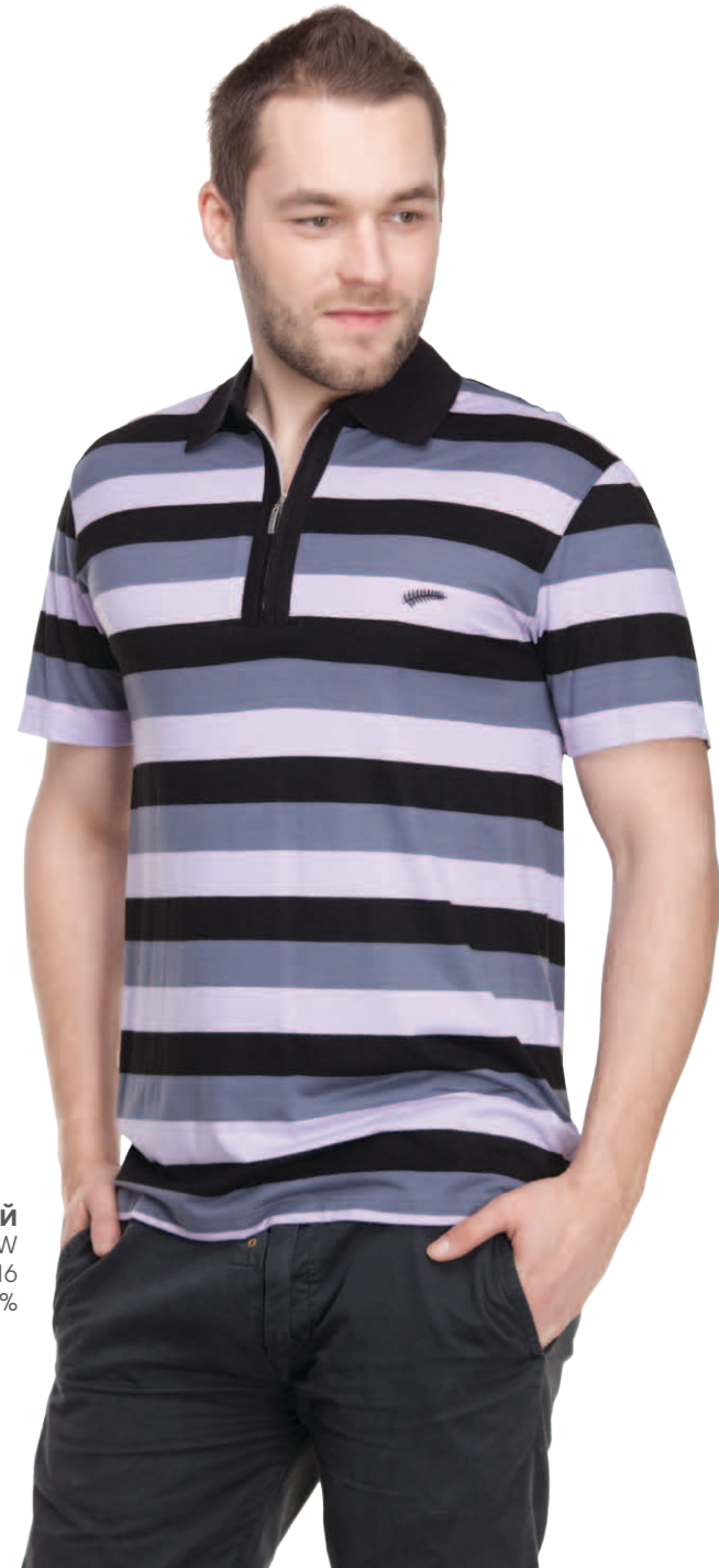
Джемпер мужской модель 2002W шкала размеров: 88-116 состав: вискоза 92%, лайкра 8%