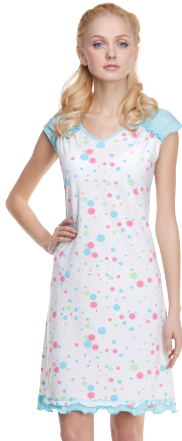
Сорочка женская модель 3854W/3854AW шкала размеров: 88-100/104-116 состав: хлопок 100%