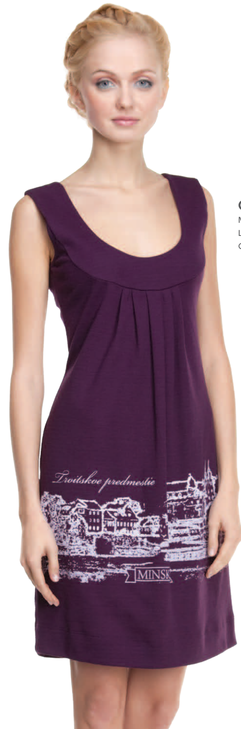
Сарафан женский модель 3863W шкала размеров: 88-104 состав: лен 8 %, хлопок 48 %, п-э 44%