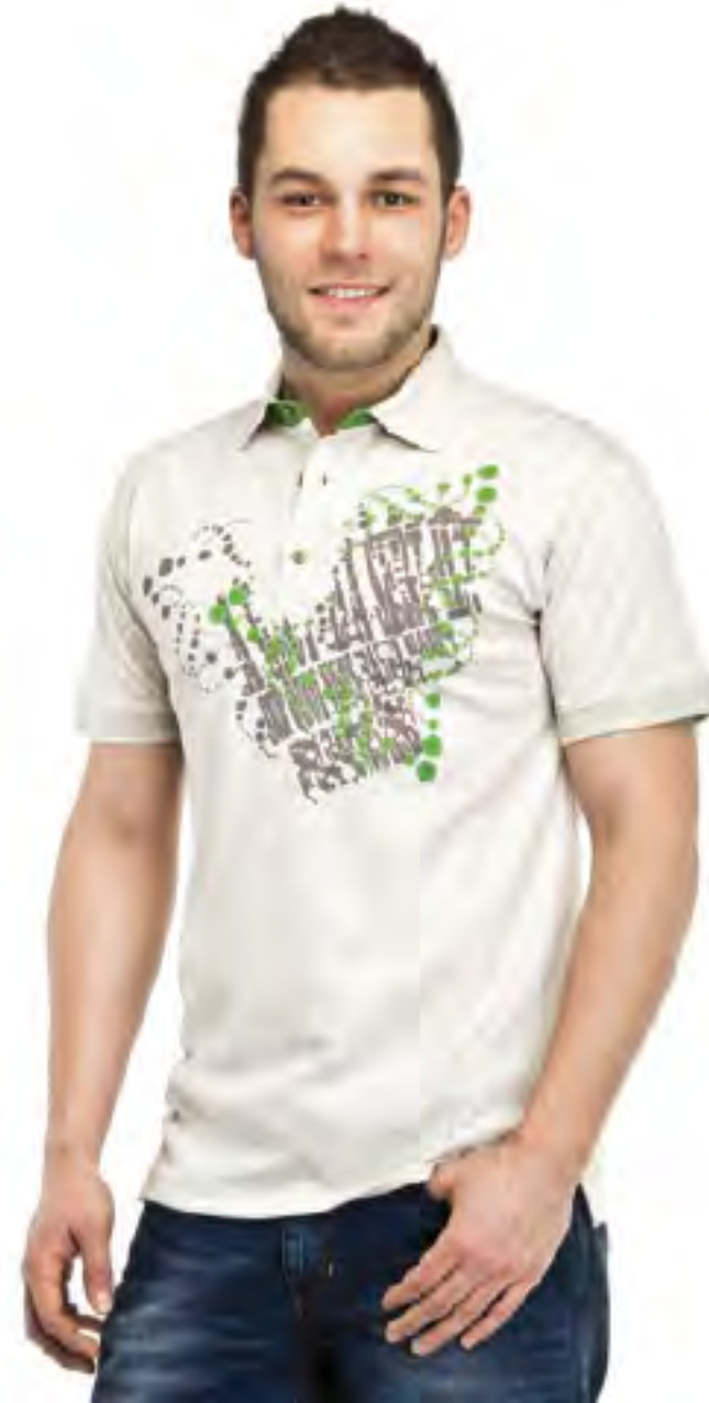
Джемпер мужской модель 1872 шкала размеров: 88-116 состав: хлопок 48%, п-э 44%, лён 8%

«Сенатор» – коллекция мужских футбоек и джемперов спортивно-городского стиля, объединяющая в себе комфорт, стильность и оригинальность.