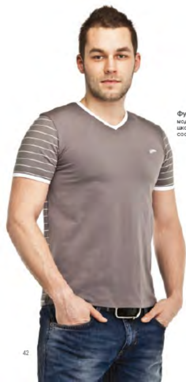
Фуфайка мужская модель 1048 шкала размеров: 88-116 состав: хлопок 95%, лайкра 5%