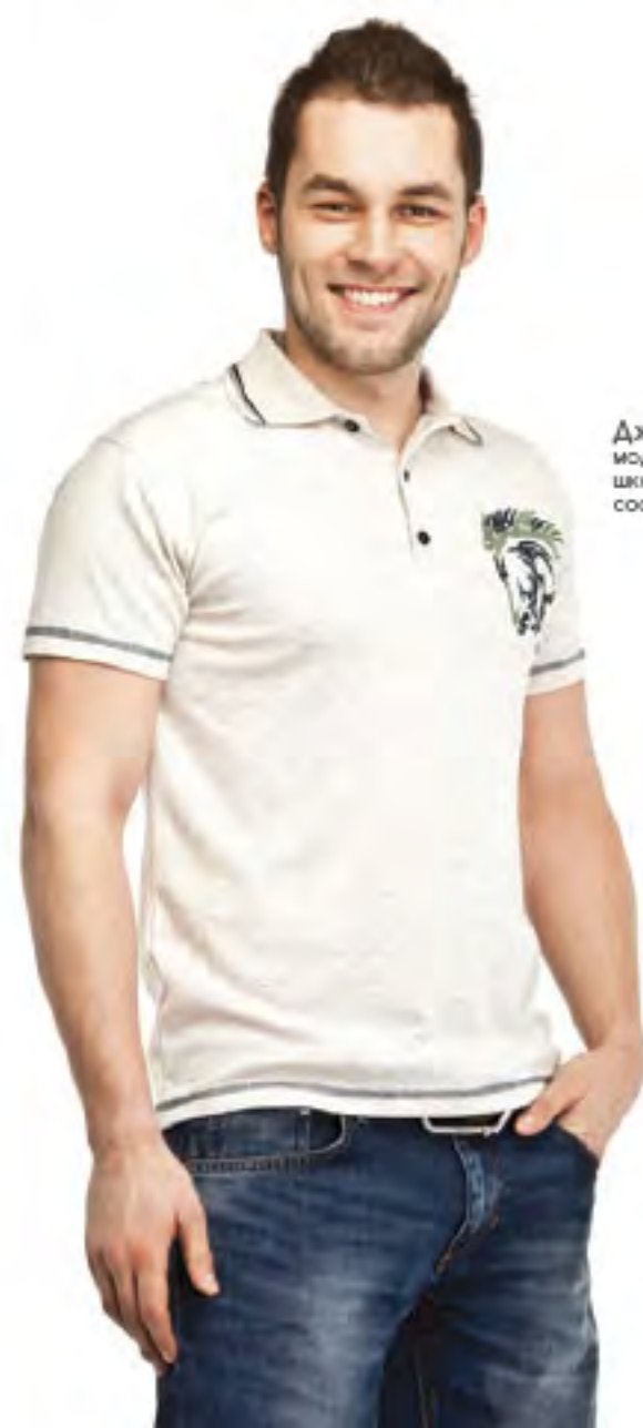
Джемпер мужской модель 1873 шкала размеров: 88-116 состав: хлопок 48%, п-э 44%, лён 8%