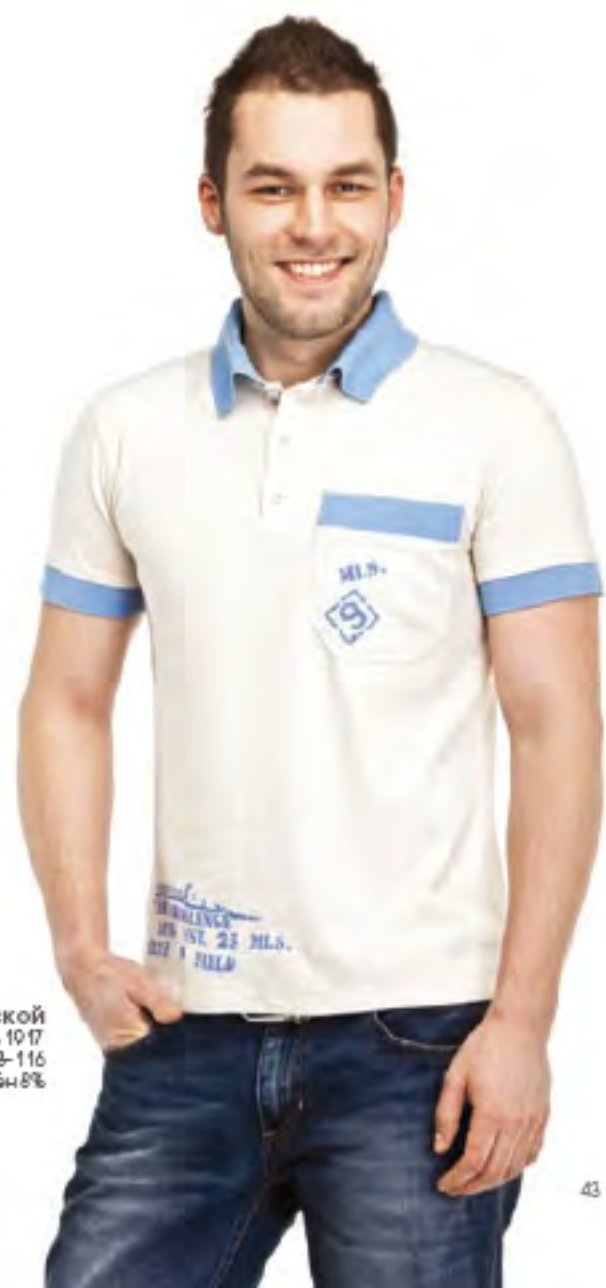
Джемпер мужской модель 1017 шкала размеров: 88-116 состав: хлопок 48%, п-э 44%, лён 8%