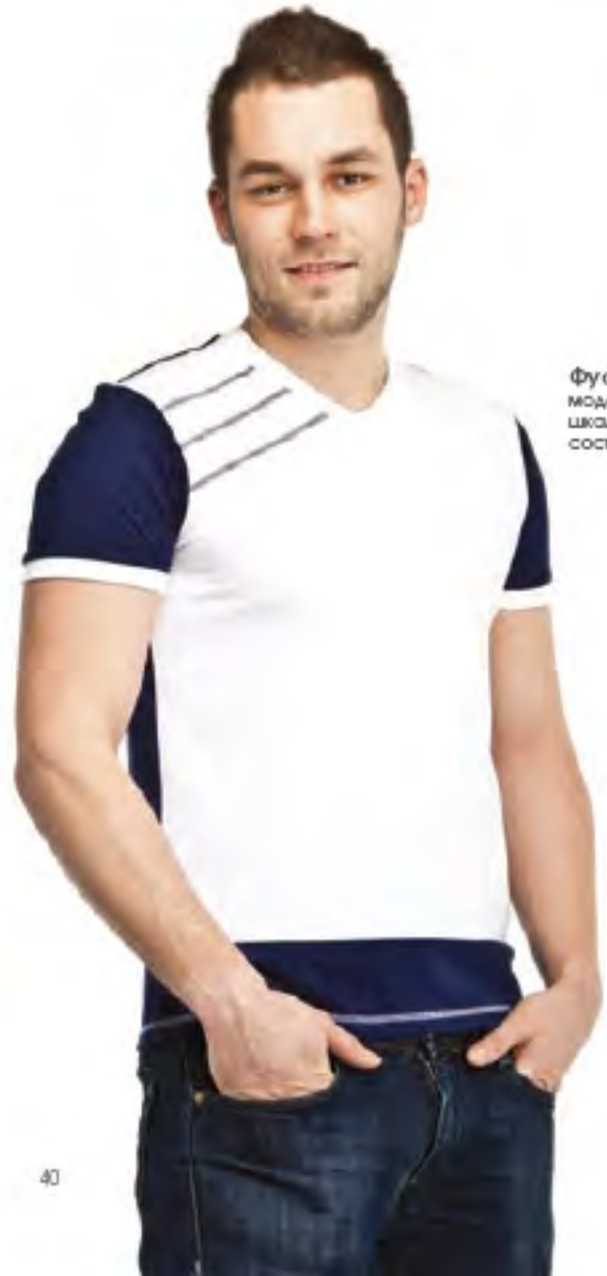
Фуфайка для мальчика модель 987 4 шкала размеров: 76-84 состав: хлопок 95%, лайкра 5%