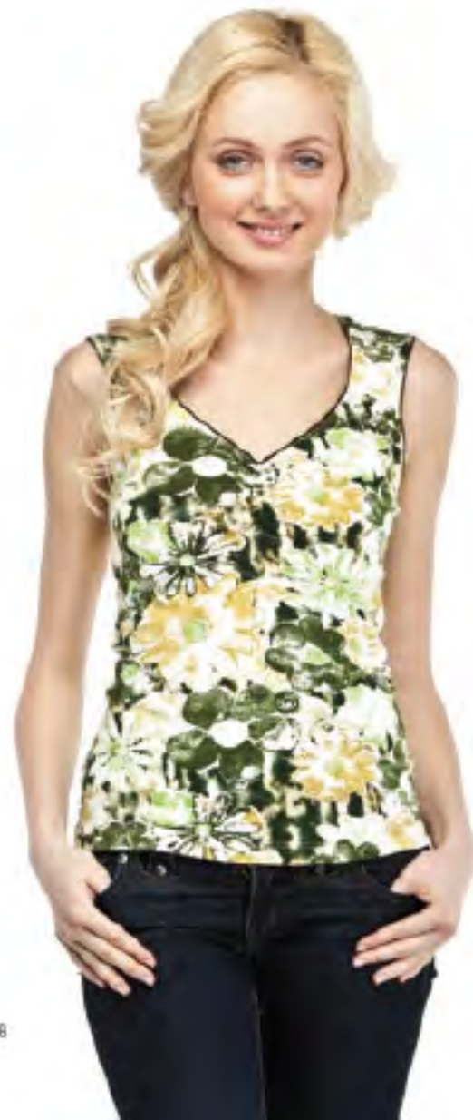
Джемпер женский модель 3653 шкала размеров: 88-116 состав: хлопок 95%, лайкра 5%