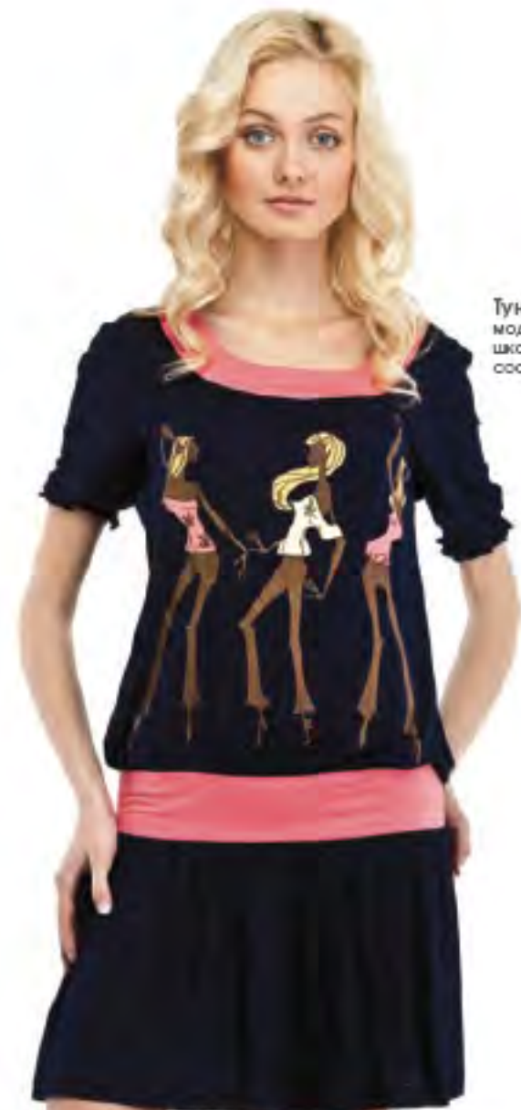
Туника женская модель 3458 шкала размеров: 84-104 состав: вискоза 100%