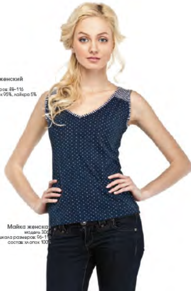
Майка женская модель 3005 шкала размеров: 96-116 состав: хлопок 100%