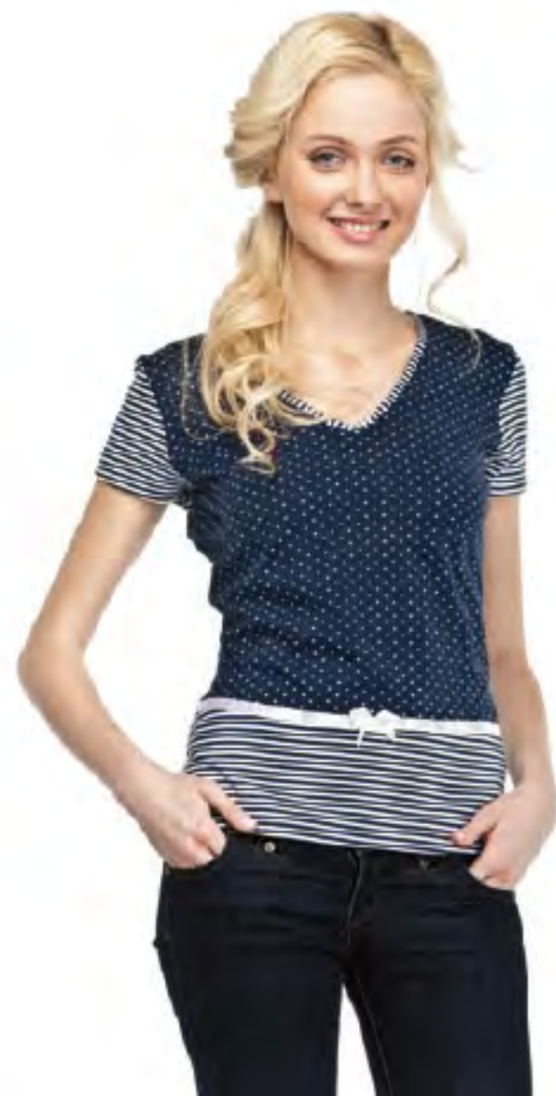
Фуфайка женская модель 3055 шкала размеров: 96-116 состав: хлопок 100%