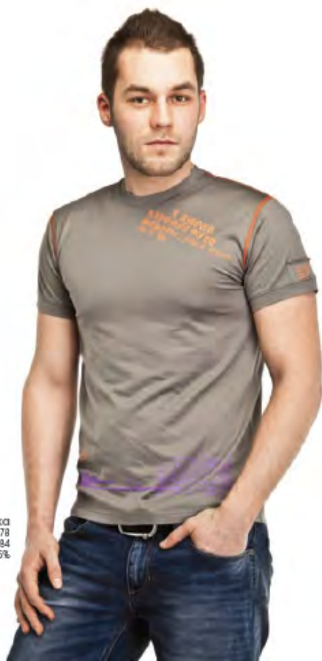
Фуфайка для мальчика модель 0878 шкала размеров: 76-84 состав: хлопок 95%, лайкра 5%