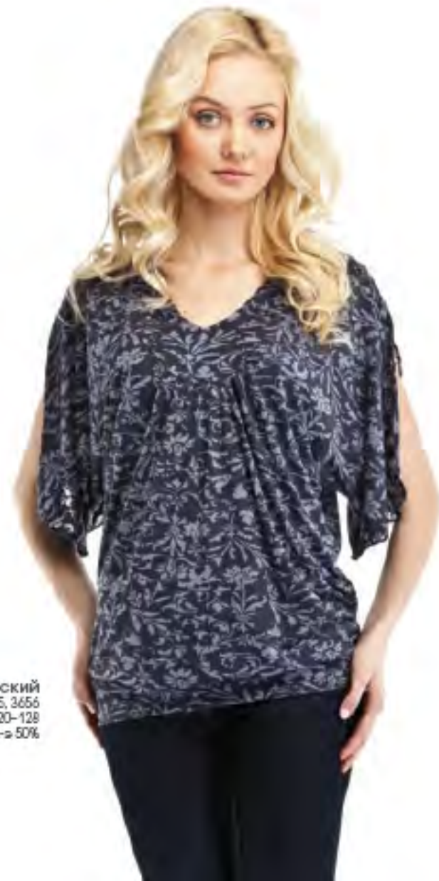
Джемпер женский модель 3655, 3656 шкала размеров: 88-116, 120-128 состав: вискоза 50%, п-э 50%