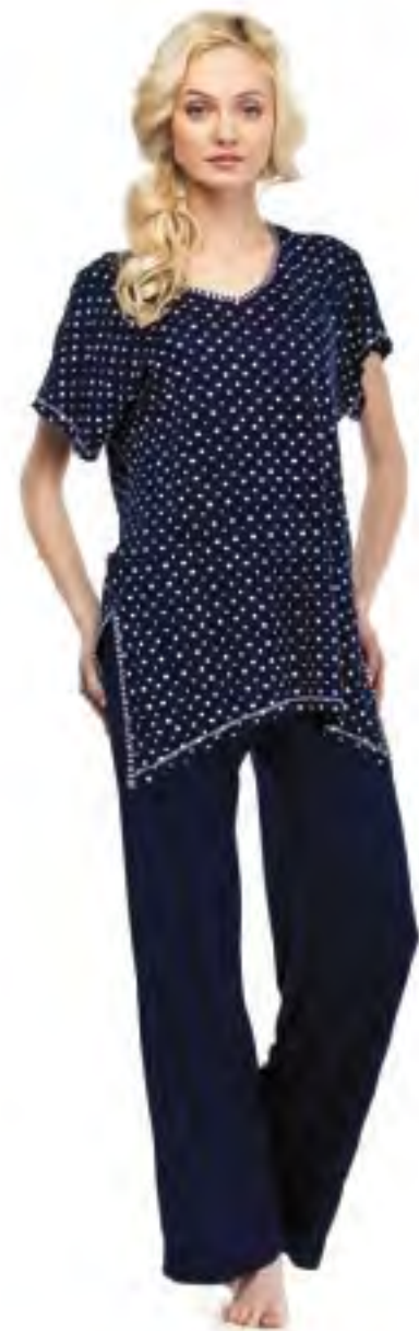
Комплект женский модель 3554 шкала размеров: 100-116 состав: вискоза 100%