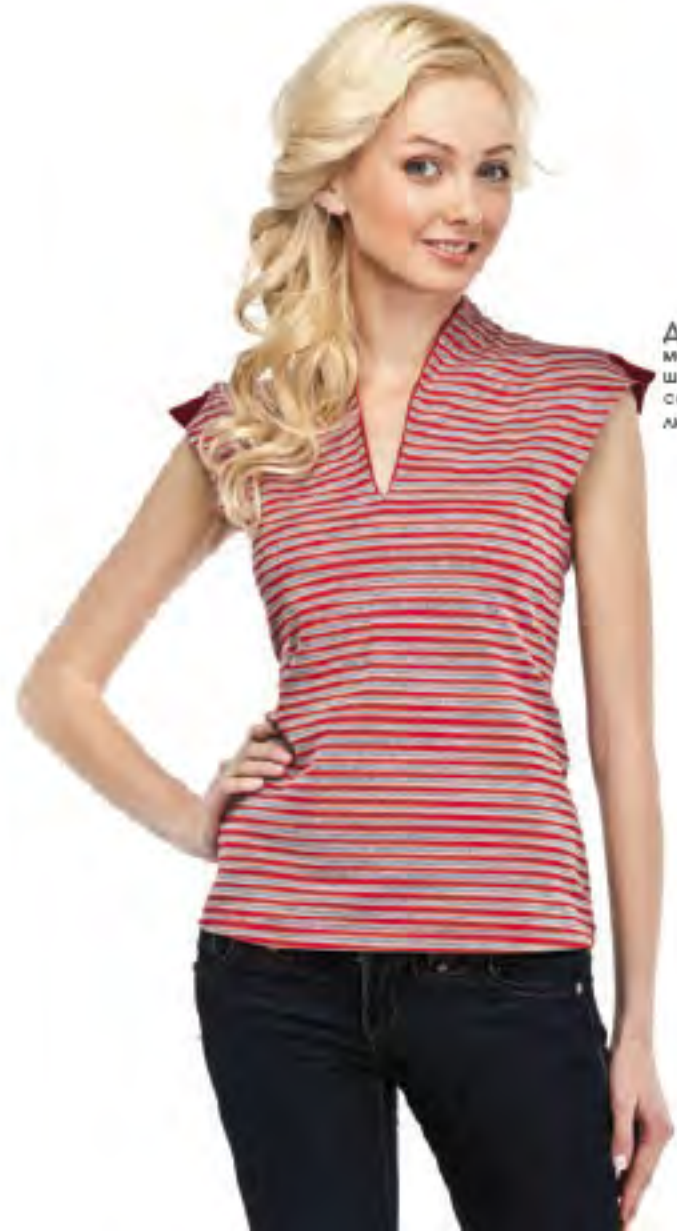
Джемпер женский модель 3646 шкала размеров: 88-108 состав: хлопок 88%, п-э 10%, модала 3%