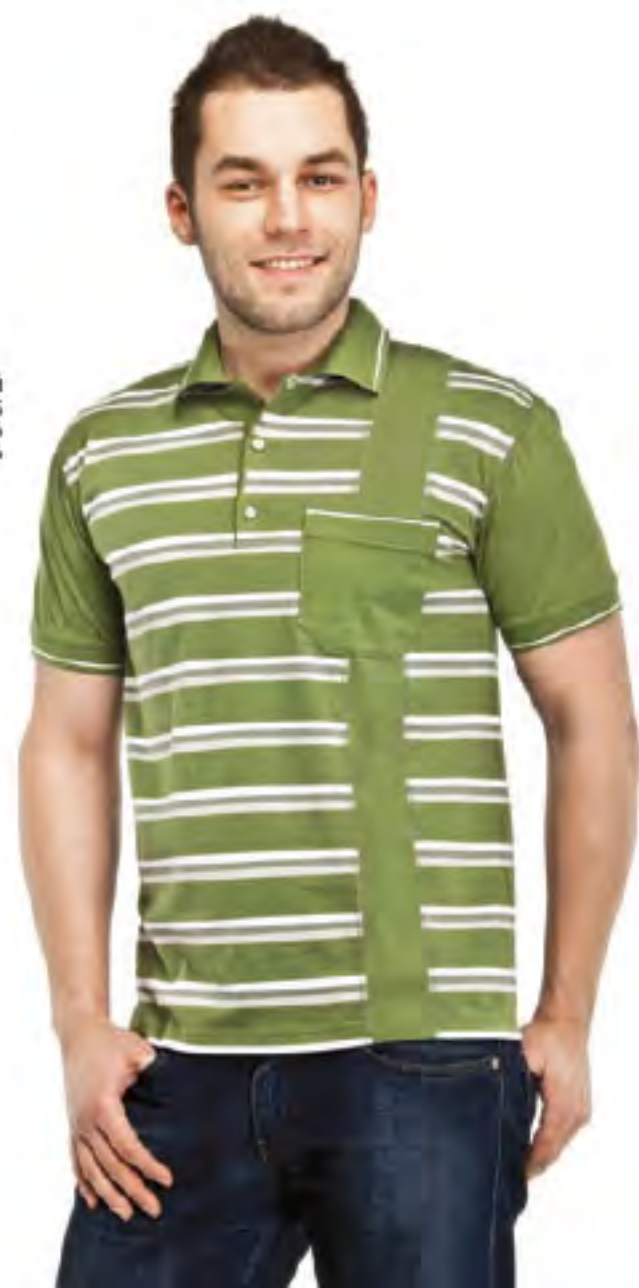
Джемпер мужской модель 1055 шкала размеров: 88-116 состав: хлопок 96%, лайкра 5%