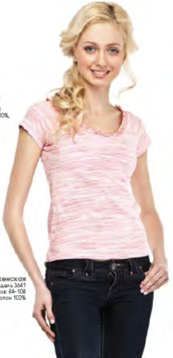
Фуфайка женская модель 3641 шкала размеров: 84-108 состав: хлопок 100%