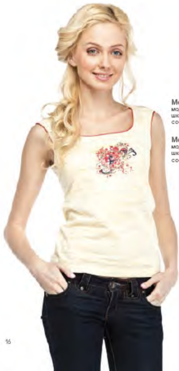
Майка женская модель 3622 шкала размеров: 88-108 состав: хлопок 100%