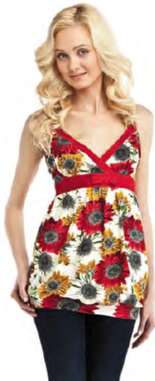
Туника женская модель 3559 шкала размеров: 84-100 состав: вискоза 92%, лайкра 8%