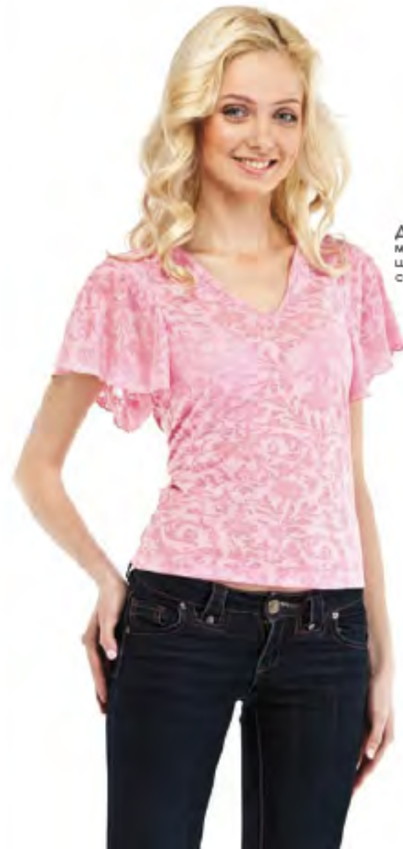
Джемпер женский модель 3568 шкала размеров: 84-104 состав: вискоза 60%, п-я 50%