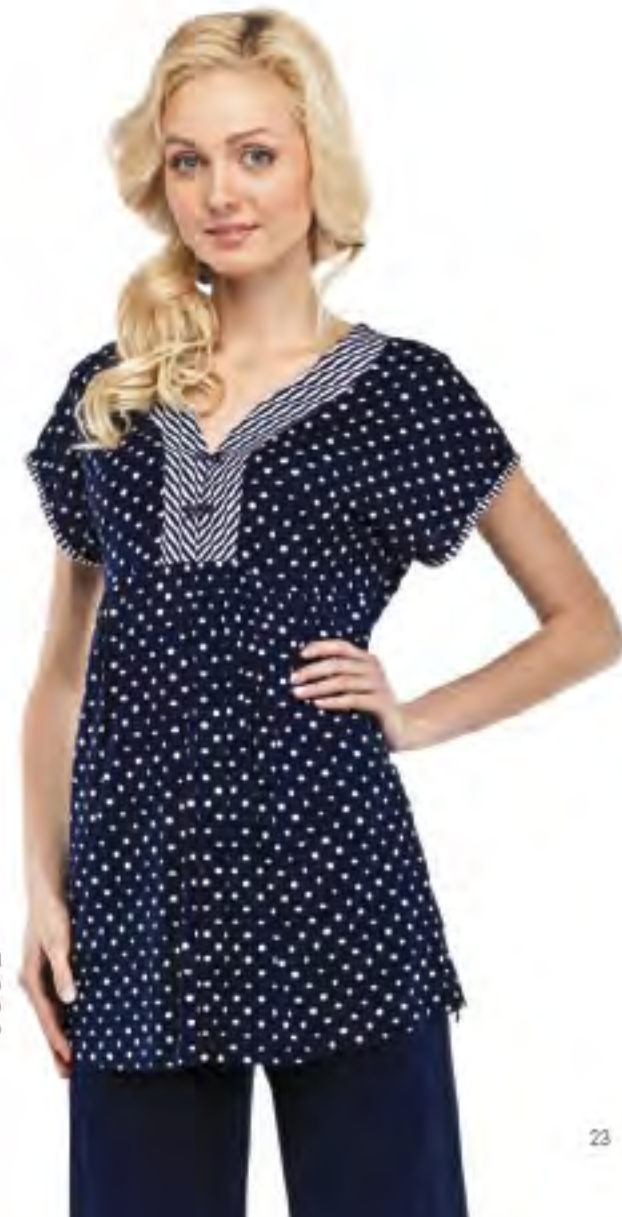
Комплект женский модель 3556 шкала размеров: 96-116 состав: вискоза 100%