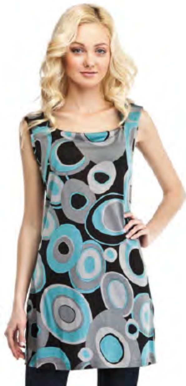
Туника женская модель 3657 шкала размеров: 88-116 состав: вискоза 100%