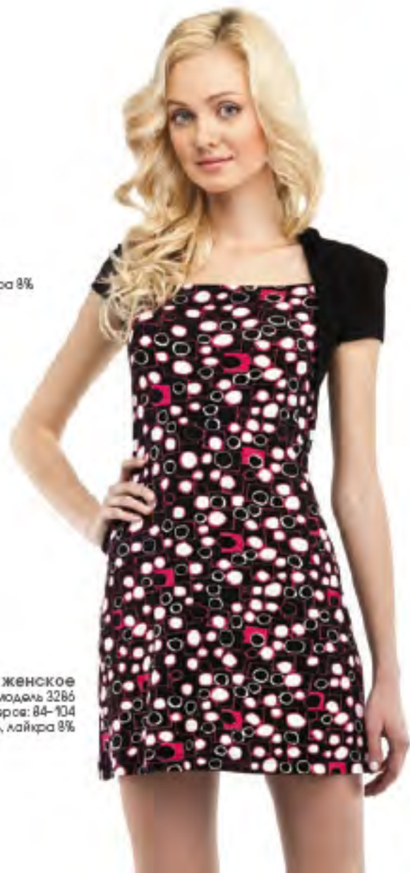
Платье женское модель 3286 шкала размеров: 84-104 состав: вискоза 92%, лайкра 8%