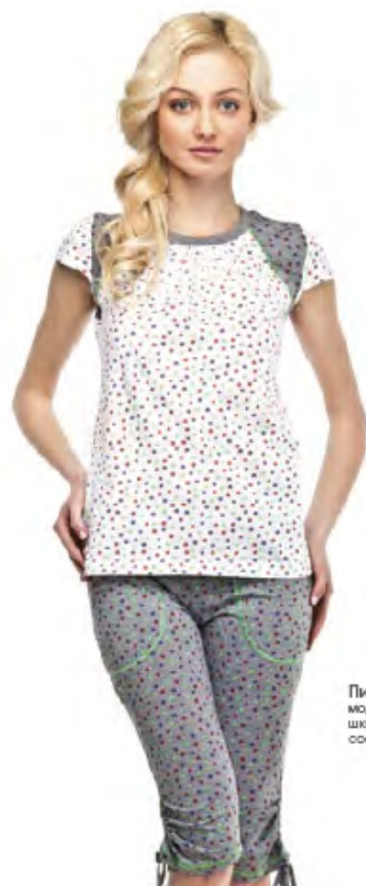
Пижамы для девочки модель 0077 шкала размеров: 76-84 состав: хлопок 100%