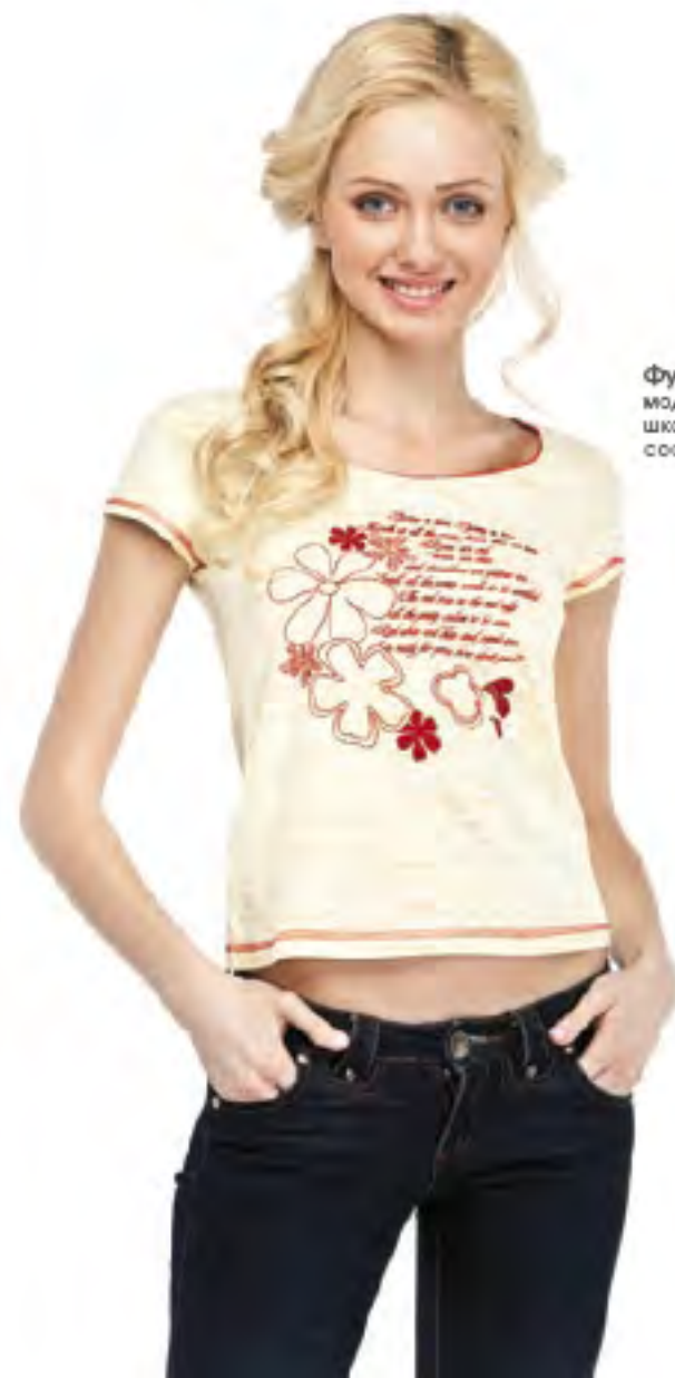
Фуфайка женская модель 3623 шкала размеров: 84-108 состав: хлопок 100%