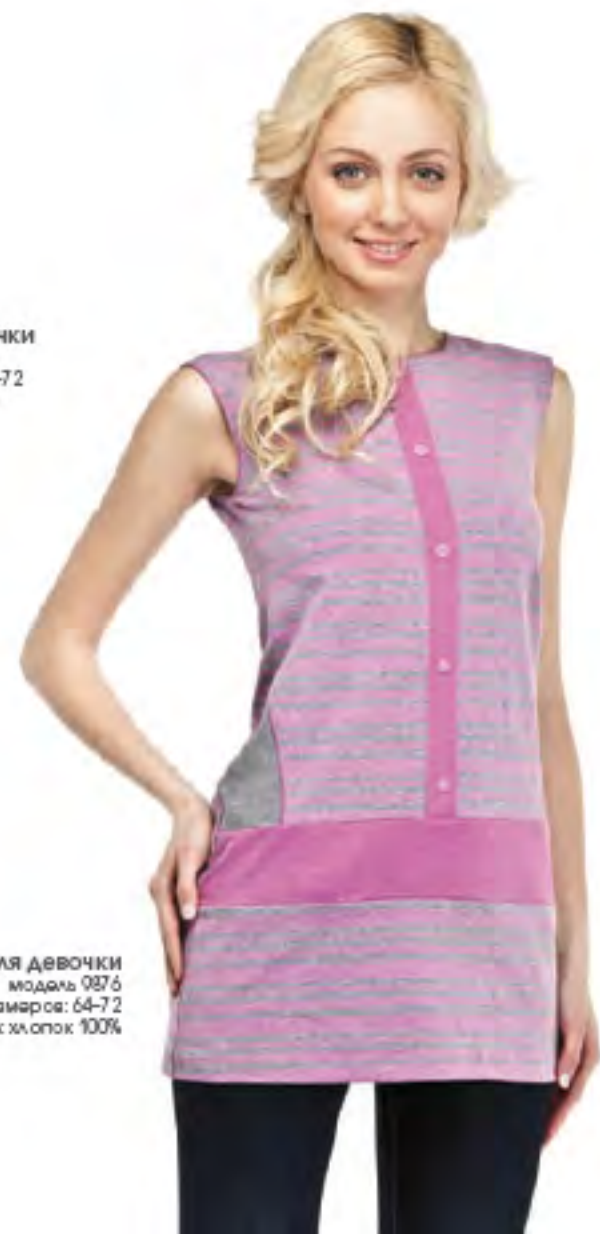
Туника для девочки модель 987 6 шкала размеров: 64-72 состав: хлопок 100%