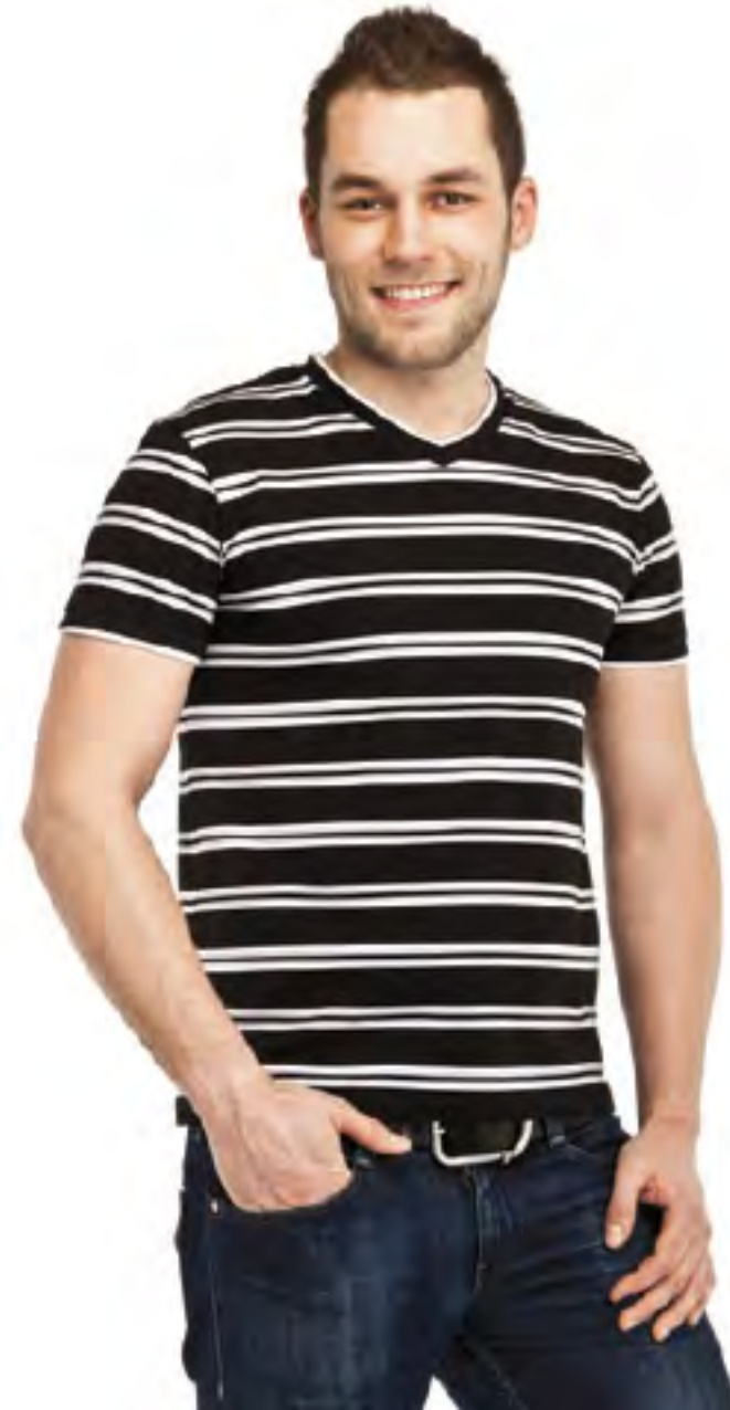
Джемпер мужской модель 1051-A шкала размеров: 88-116, 120-132 состав: хлопок 95%, лайкра 5%