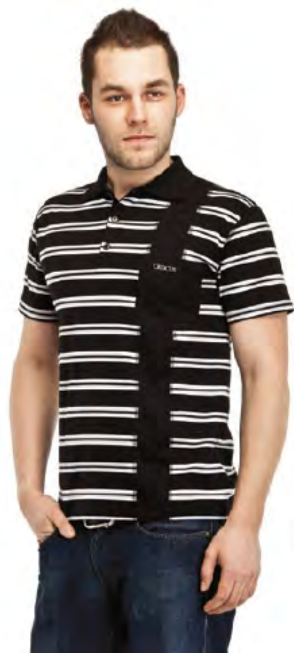
Джемпер мужской модель 1054 шкала размеров: 88-116 состав: хлопок 96%, лайкра 5%