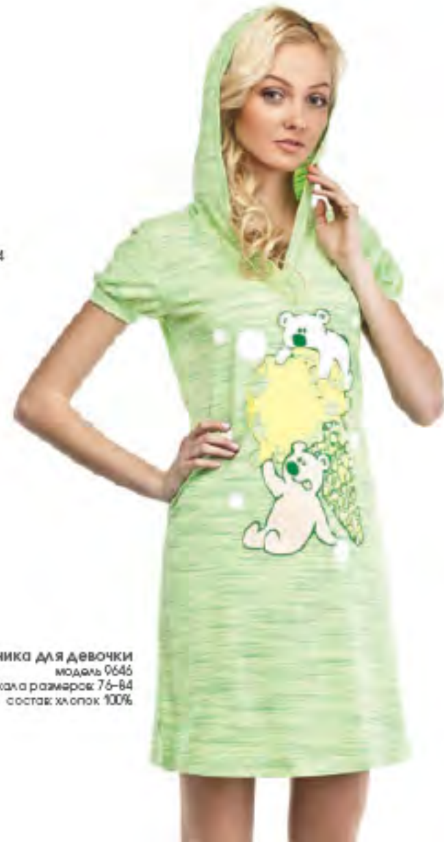
Туника для девочки модель 0646 шкала размеров: 76-84 состав: хлопок 100%