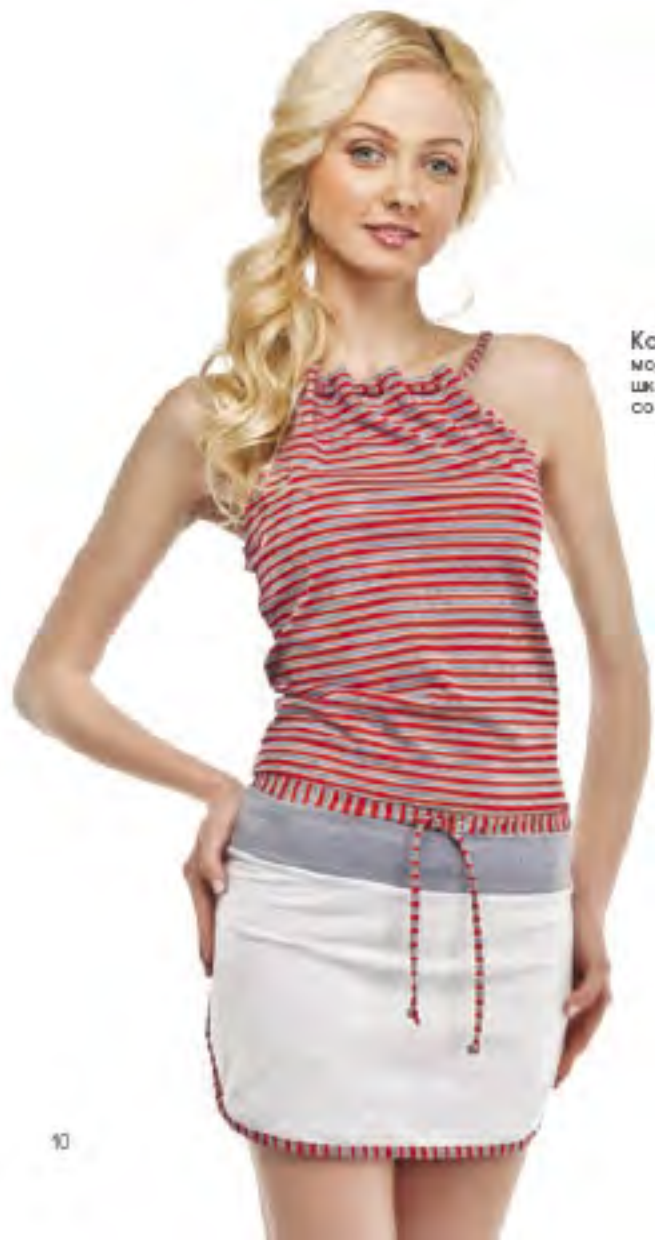
Комплект для девочки модель 8000 шкала размеров: 76-84 состав: хлопок 88%, п-э 10%, модала 3%