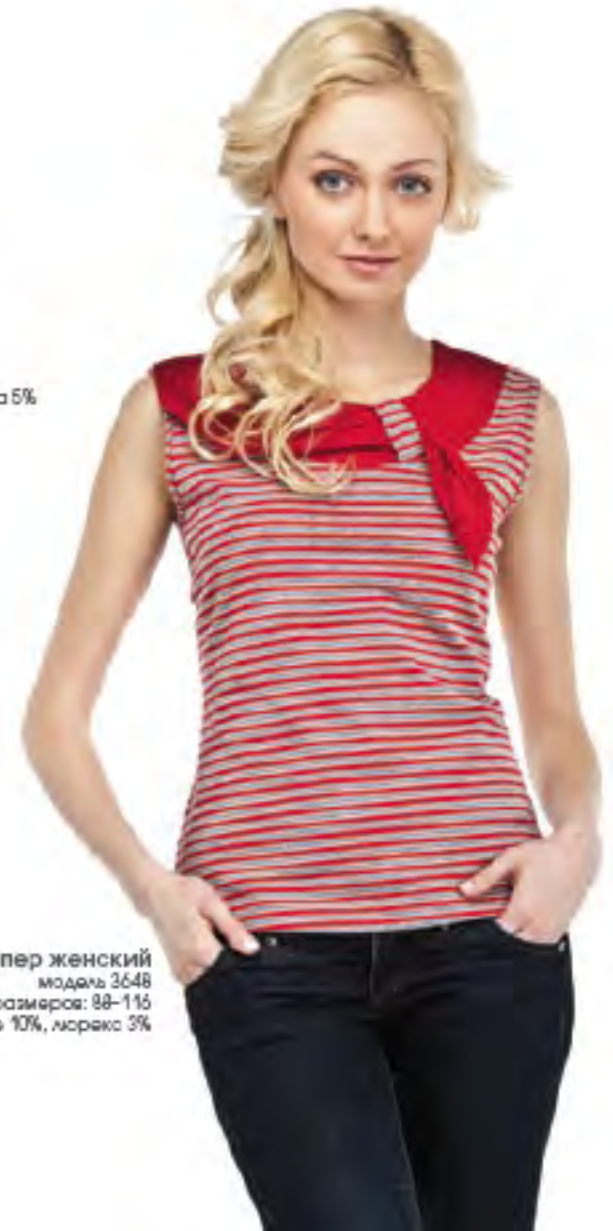
Джемпер женский модель 3648 шкала размеров: 88-116 состав: хлопок 88%, п-э 10%, модала 3%