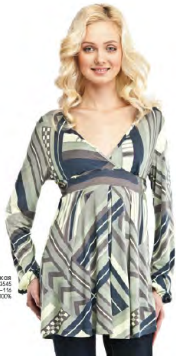
Туника женская модель 3545 шкала размеров: 84-116 состав: вискоза 100%