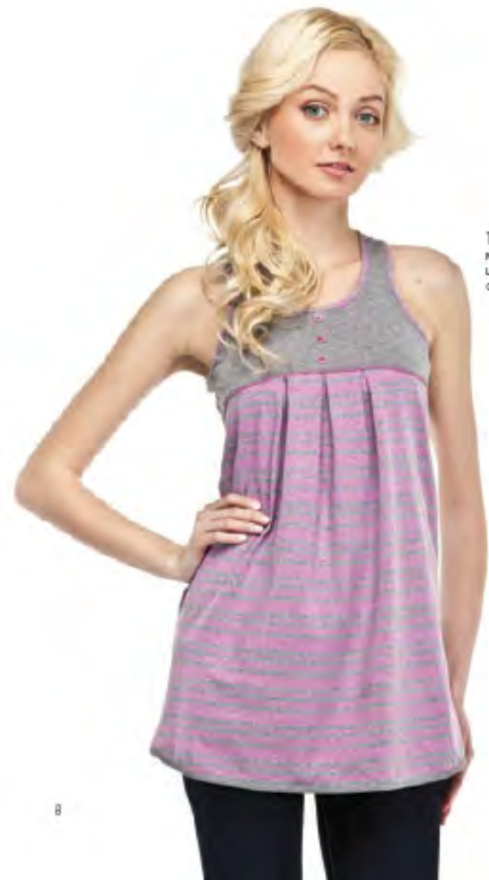
Туника для девочки модель 997 1 шкала размеров: 64-72 состав: хлопок 100%