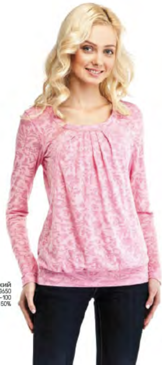
Джемпер женский модель 3550 шкала размеров: 84-100 состав: вискоза 50%, п-я 50%