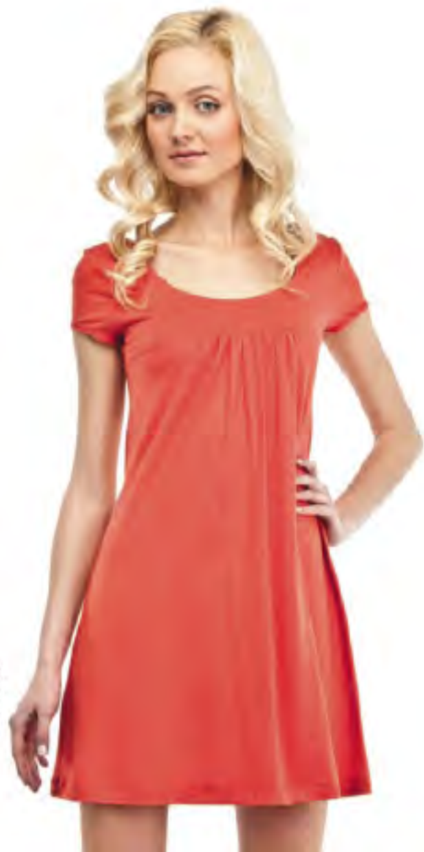
Туника женская модель 3659 шкала размеров: 84-100 состав: вискоза 92%, лайкра 8%