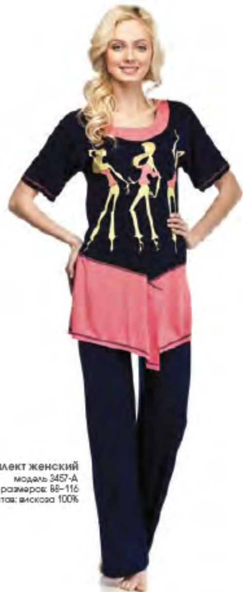
Комплект женский модель 3457-А шкала размеров: 88-116 состав: вискоза 100%