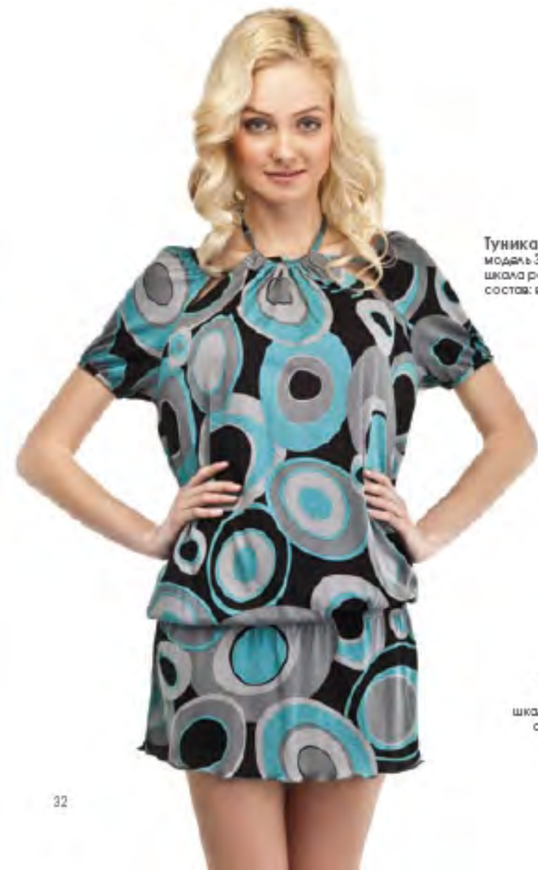
Туника женская модель 3573 шкала размеров: 84-104 состав: вискоза 100%