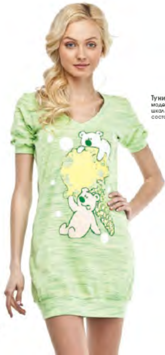
Туника женская модель 3548 шкала размеров: 84-104 состав: хлопок 100%