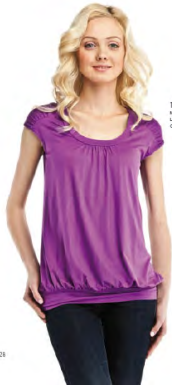
Туника женская модель 3663 шкала размеров: 84-104 состав: вискоза 92%, лайкра 8%