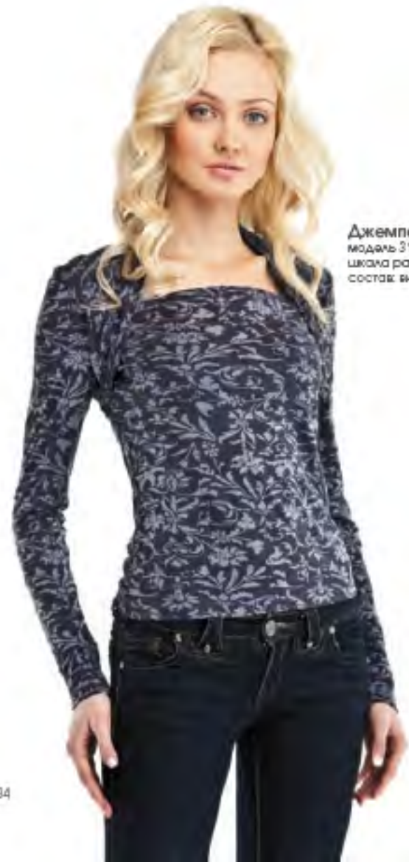
Джемпер женский модель 3130 шкала размеров: 88-104 состав: вискоза 60%, п-э 50%