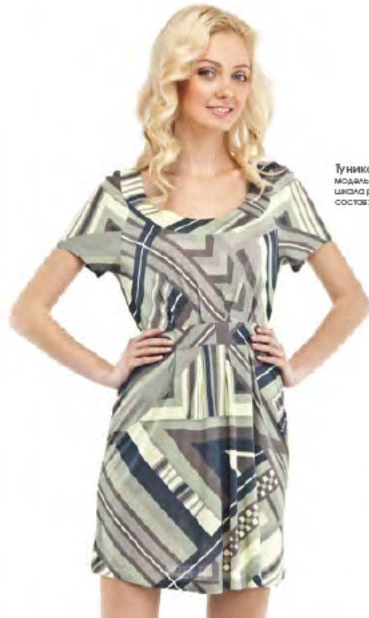
Туника женская модель 3571 шкала размеров: 84-104 состав: вискоза 100%