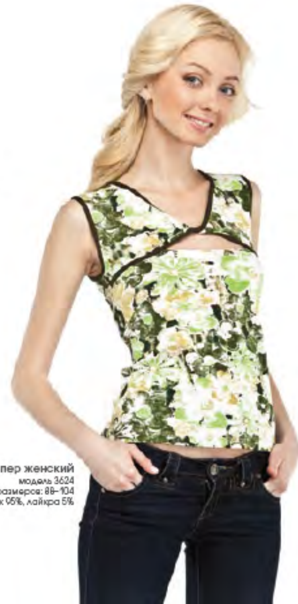
Джемпер женский модель 3624 шкала размеров: 88-104 состав: хлопок 95%, лайкра 5%