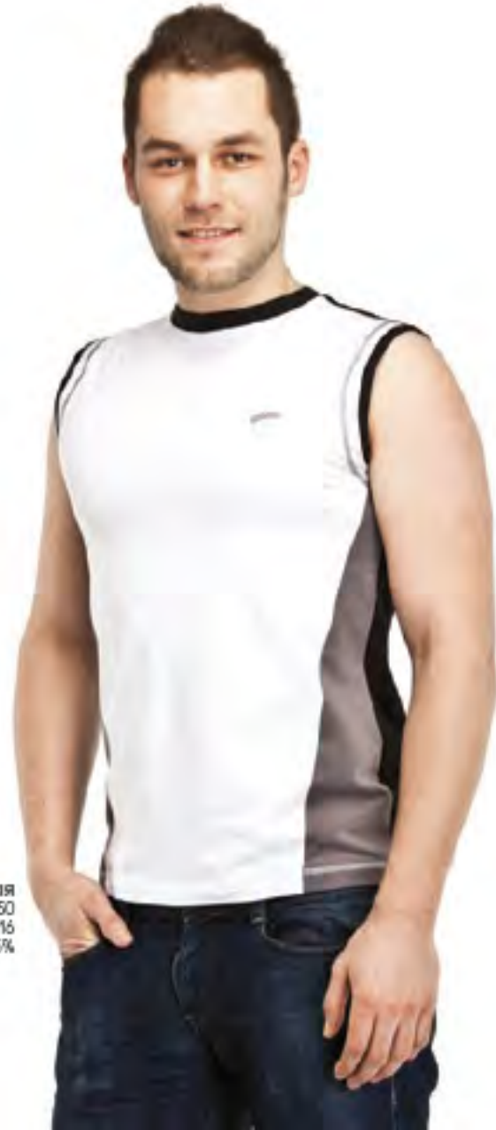
Майка мужская модель 1050 шкала размеров: 88-116 состав: хлопок 95%, лайкра 5%