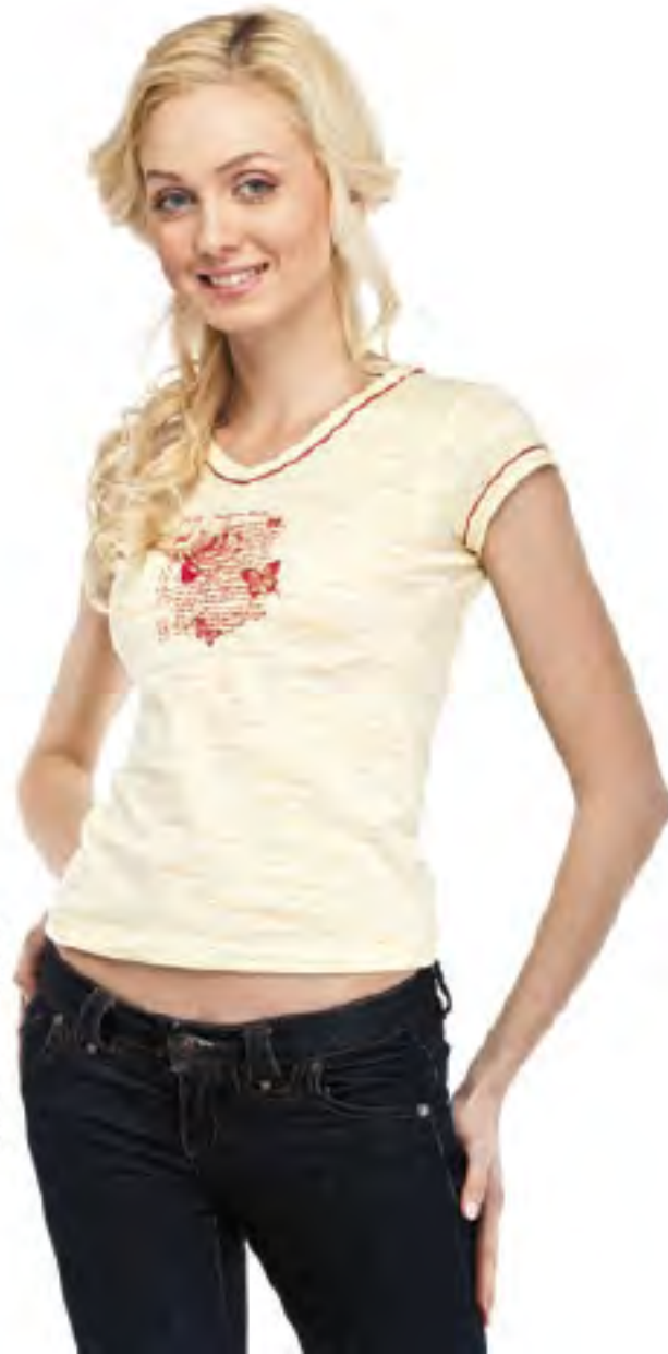
Фуфайка женская модель 3624 шкала размеров: 88-108 состав: хлопок 100%